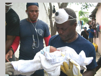
Secours et soutien sanitaire dans le cadre de catastrophes