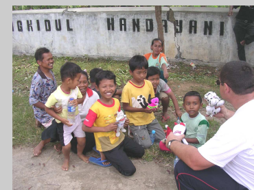
Actions humanitaires, sociales et formations