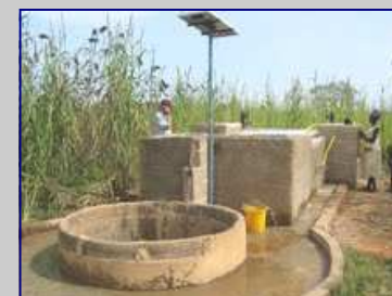
Purification de l'eau